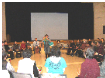
昨年度の女性のつどいの様子（2/28）