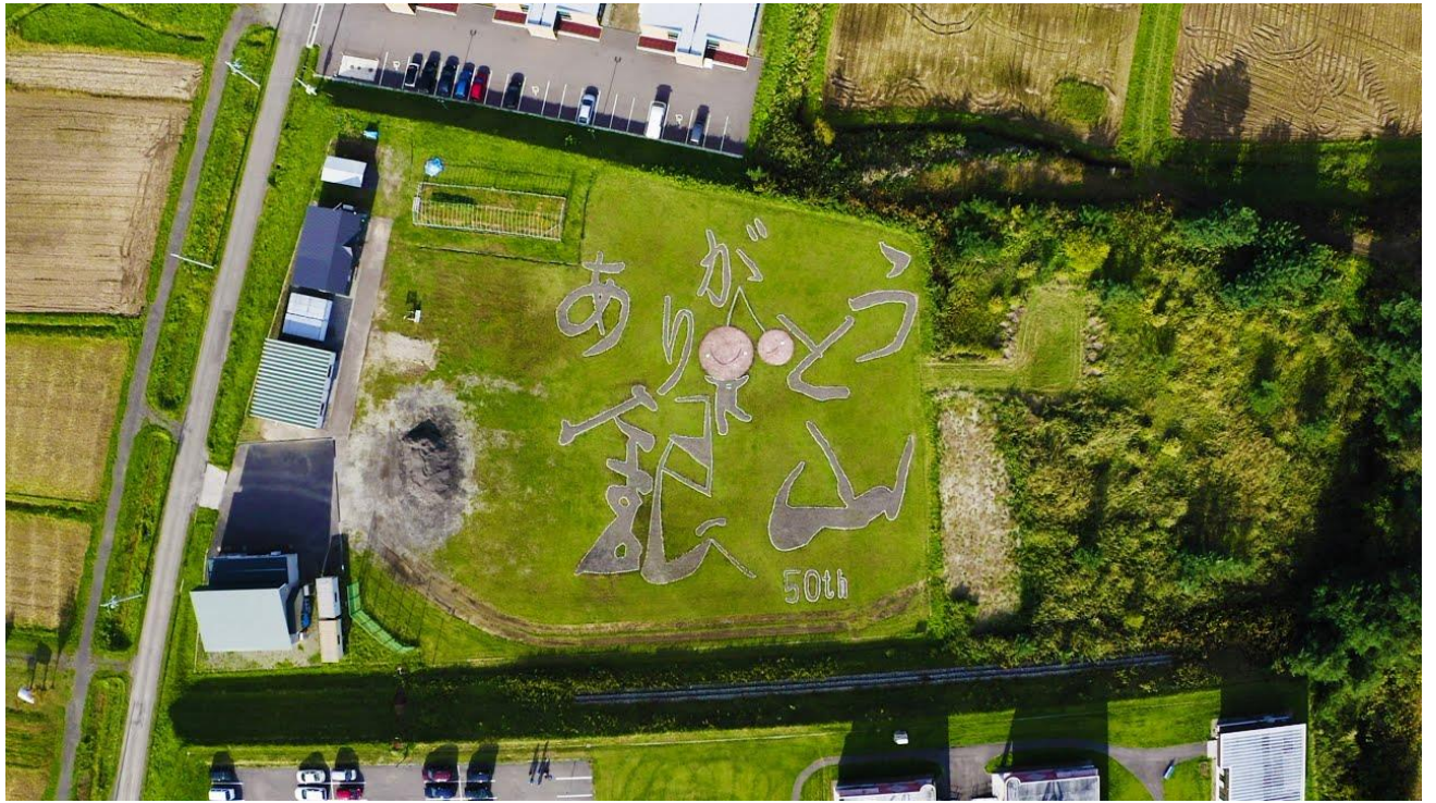
↑ 銀山学園の地上絵をドローンで撮影 ↓ 農家さんでのトマト収穫の様子