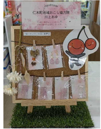
↑ 仁木町の素材で作った アクセサリーなど