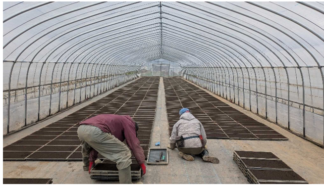
↑ 研修先風景 ↓