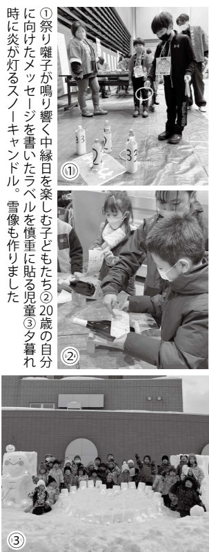
①祭り囃子が鳴り響く中縁日を楽しむ子どもたち②20歳の自分に向けたメッセージを書いたラベルを慎重に貼る児童③雪暮れ時に炎が灯るスノーキャンドル。雪像も作りました

2月18日には役場庁舎屋外で第9回講座「スノーキャンドルを作ろう」を開催し、20名の小学生が参加しました。町内で活動するボランティア団体「絆」の団員8名の協力のもと、バケツで成形した約150個のスノーキャンドルが完成し、ろうそくの優しい炎が会場を包み込みました。