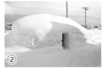
①雪山を造設する「絆」のメンバー ②完成したかまくら