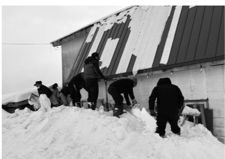
除雪作業を行うボランティアの皆さん

2月5日、仁木消防団が高齢者世帯等を対象とした除雪ボランティアを行いました。 当日は、消防団員のほか、北後志消防組合仁木支署の職員や社会福祉協議会の職員など、計55名が参加し、4世帯の除雪を実施。 除雪を行ってもらった世帯の方々は、「ありがとうございます」と深く感謝されています。