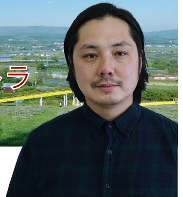
地域おこし協力隊