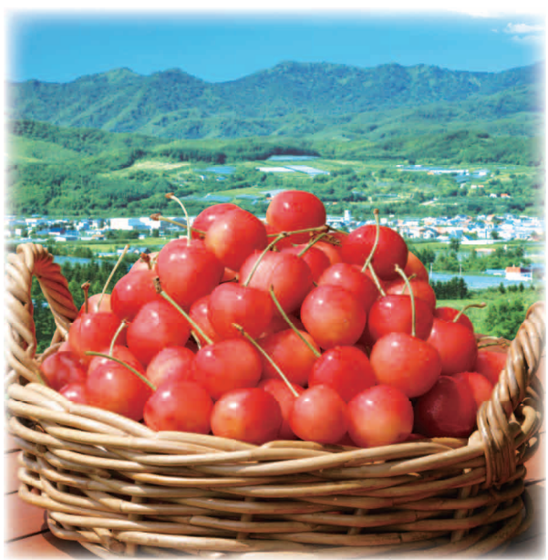
ふるさと納税返礼品で大人気だった本町のサクランボ