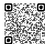
札幌法務局 ホームページ

札幌法務局公式LINEでは、友達登録により、イベント情報がいち早く取得できます。