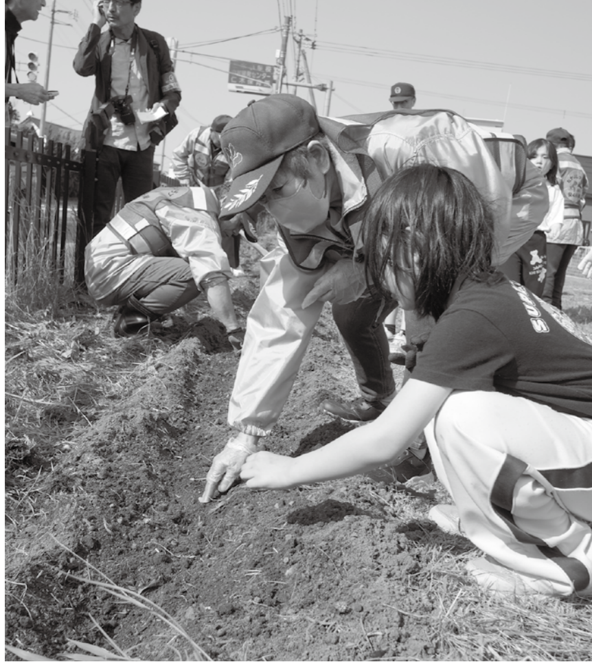
放課後児童クラブでは、なかよしクラブ・安心警ら隊の皆さんがお手伝い

交通事故防止と命の大切さを伝える「ひまわりの絆プロジェクト」が、5月22日、仁木地区の放課後児童クラブにて、5月25日、銀山へき地保育所で行われました。子どもたちは、余市警察署員や関係者とともに、交通安全への願いをひまわりの種に込めました。