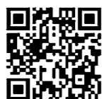
相続登記 相談センター